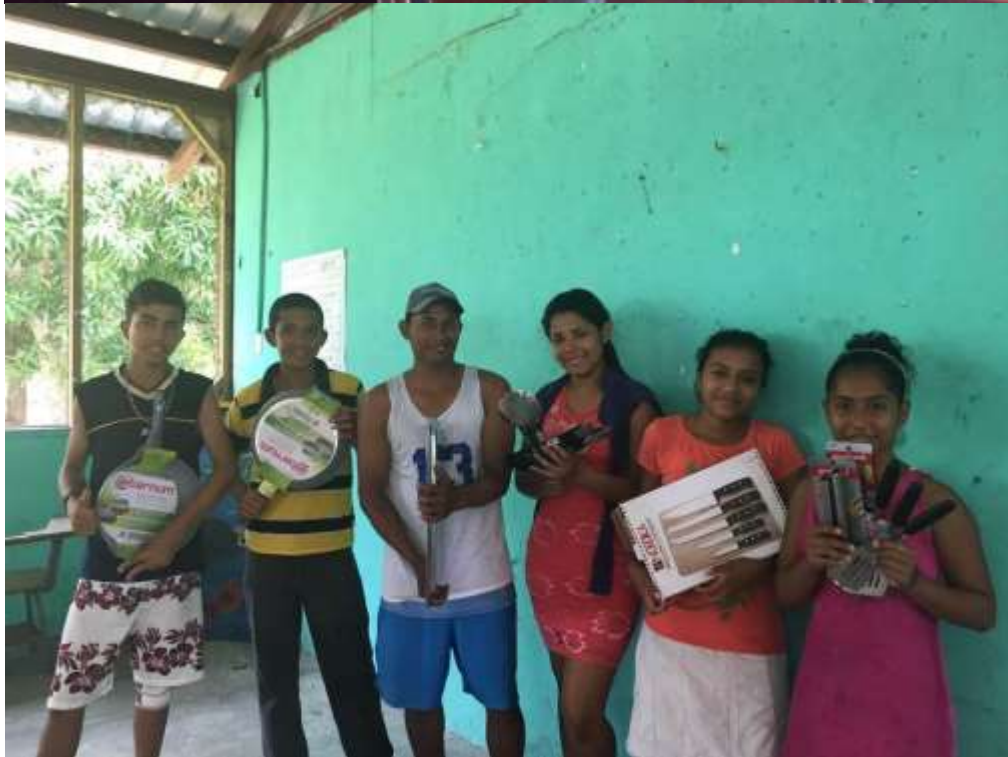
Anexo 24. Entrega de utensilios de cocina para elaboración de ventas de comida.