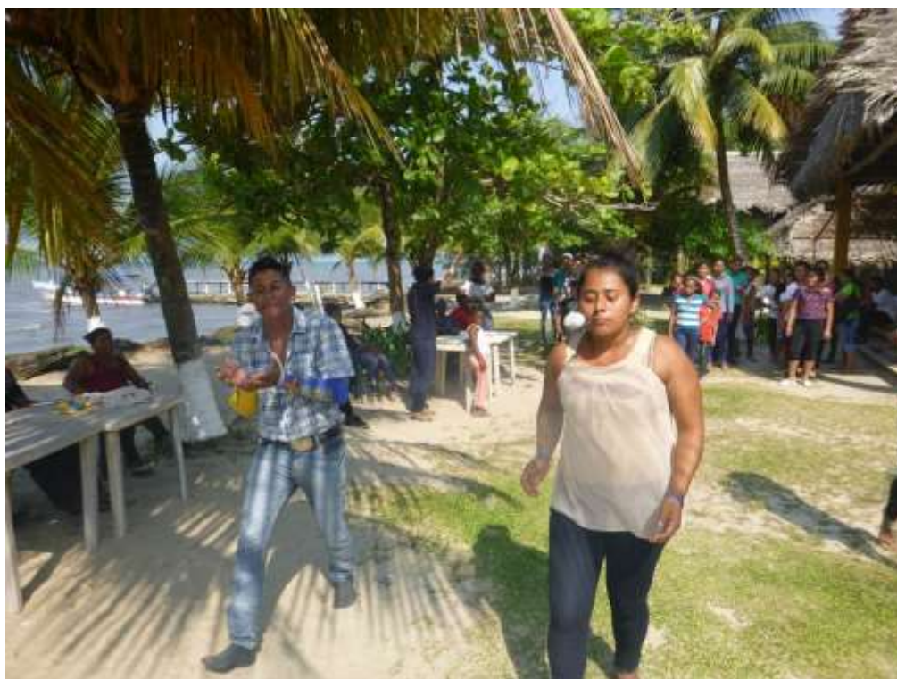
Anexo 41. Juego del huevo en la cuchara, actividad de convivencia.