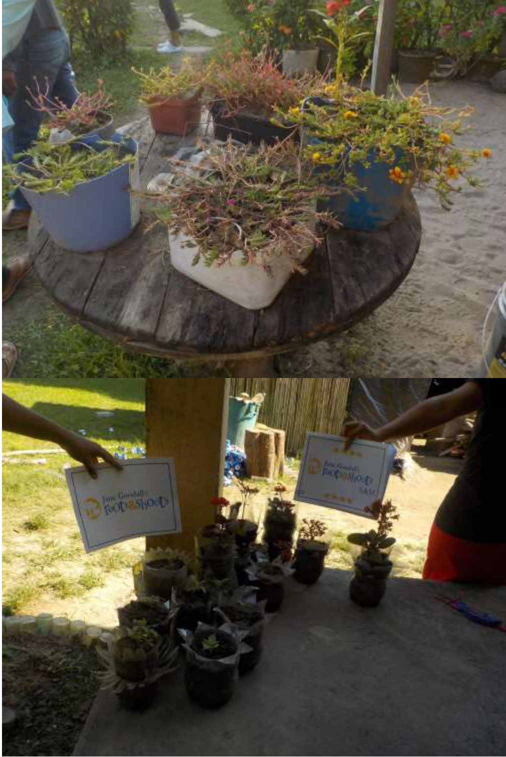
Anexo 46. Utilización de recipientes plásticos para macetas ornamentales.