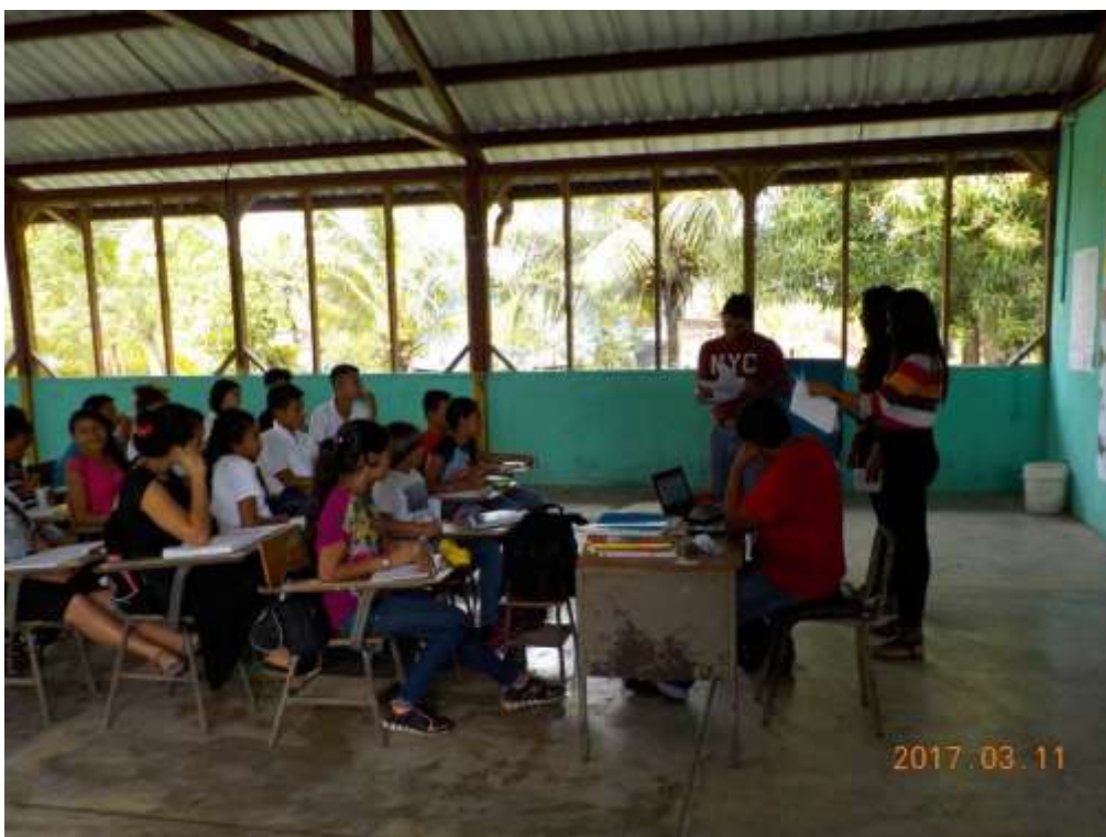
Anexo 12. Impartición de clases a estudiantes de básicos.