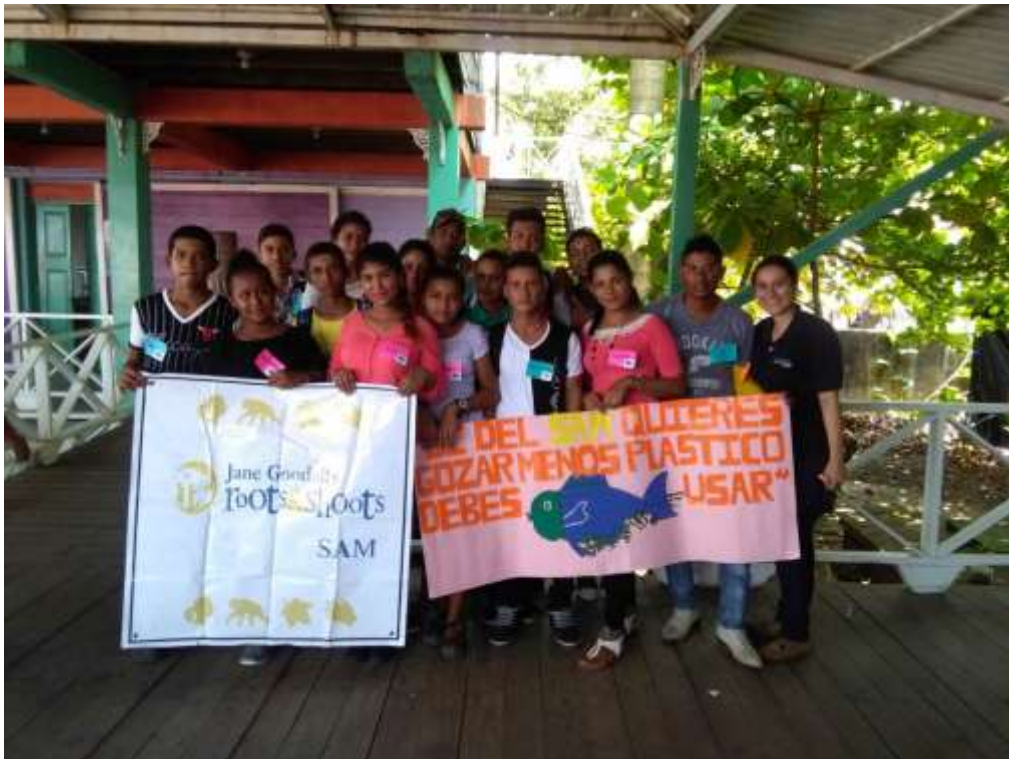
Anexo 37. Representantes de la comunidad El Quetzalito.