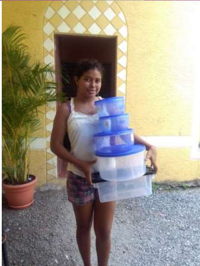
Anexo 25. Entrega de recipientes plásticos para elaboración de ventas de comida.