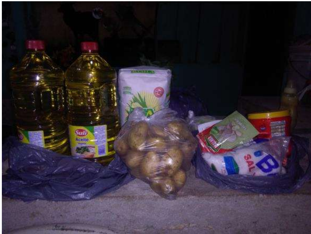
Anexo. Entrega de insumos para elaboración de comidas para venta.