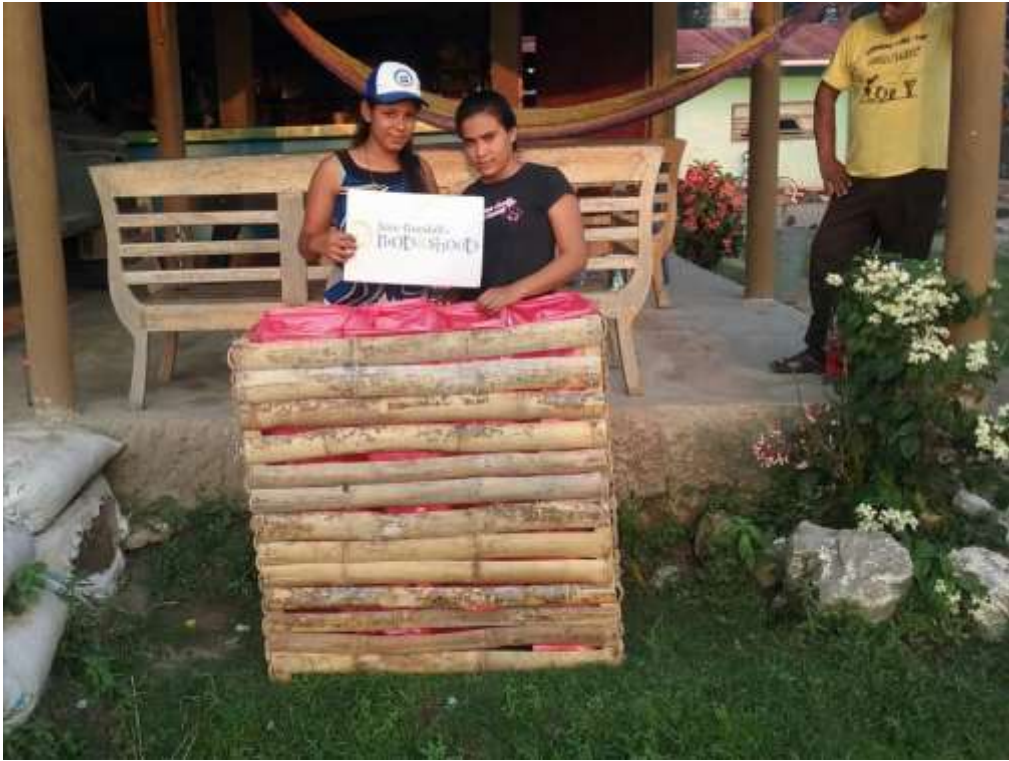
Anexo 20. Instalación de basureros en tiendas.