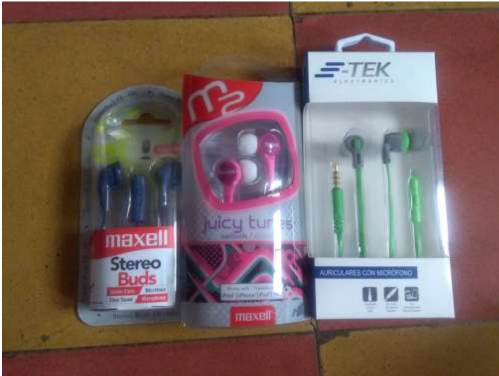
Anexo 38. Compra de premios para entrega en juegos de convivencia para la Celebración.