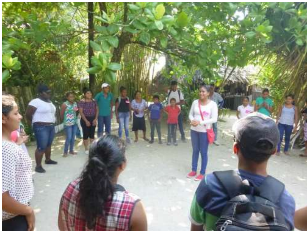
Anexo 39. Dinámicas para presentación ante jóvenes de Quetzalito y de EcoLogic.