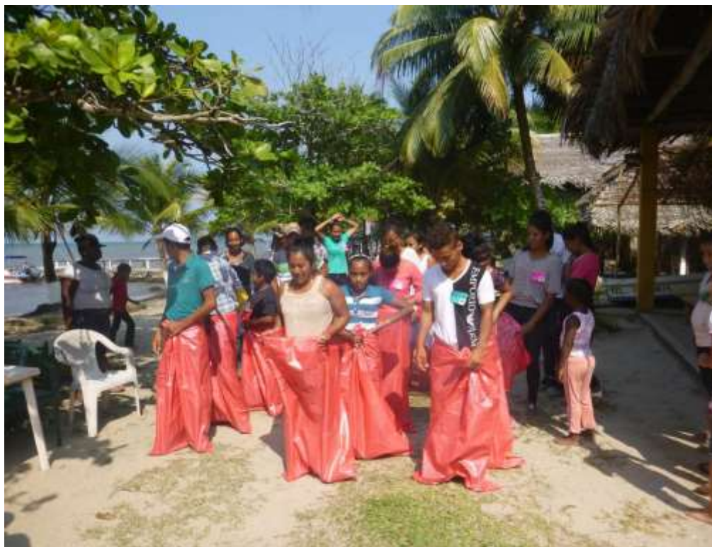
Anexo 40. Juego de encostalados Quetzalito – EcoLogic.