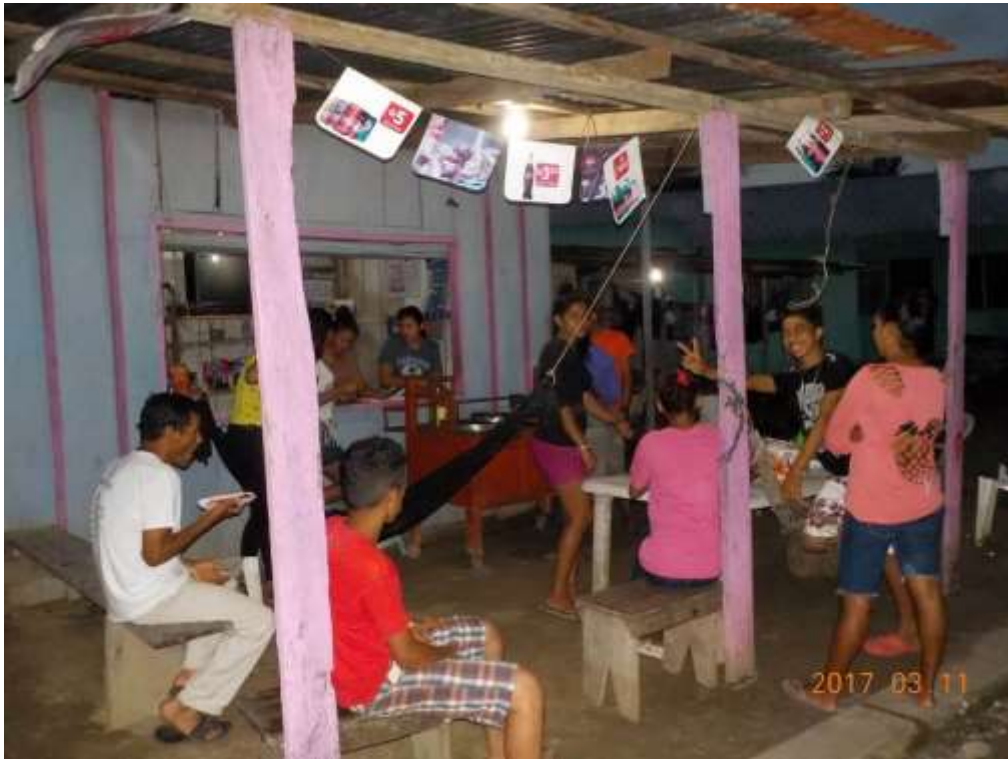
Anexo 21. Primera venta de comida: pollo con tajadas.