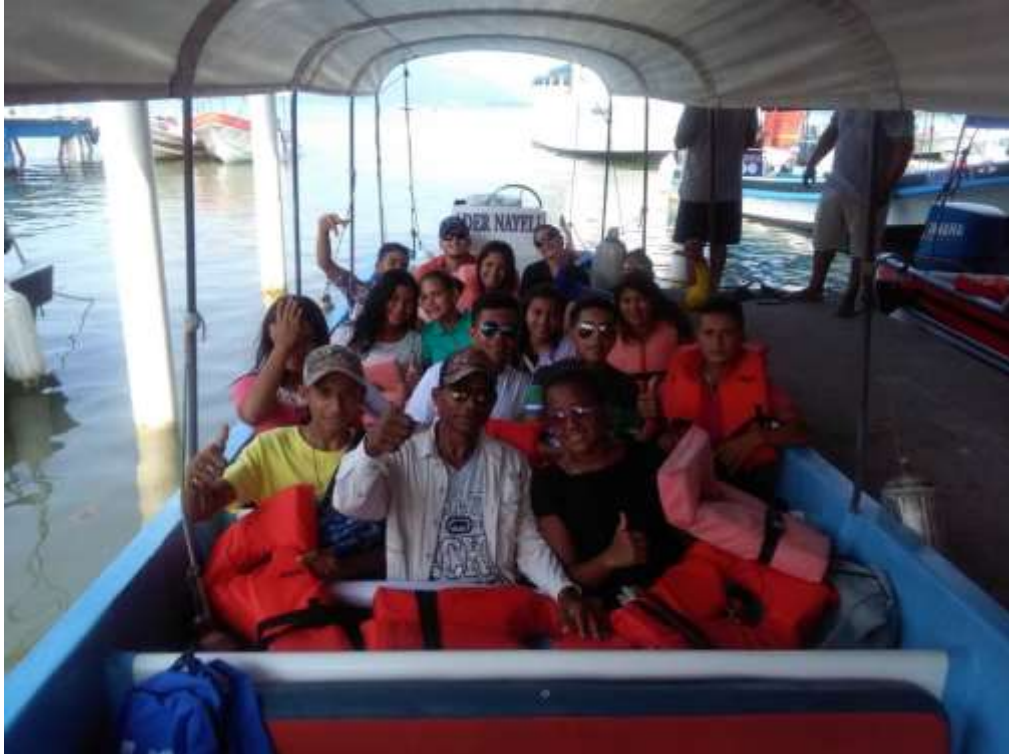
Anexo 29. Traslado de jóvenes de El Quetzalito a Livingston para presentación de resultados.