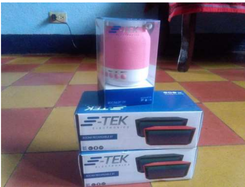
Anexo 43. Compra de premios para jóvenes con mayor participación en la campaña R&S SAM en El Quetzalito.