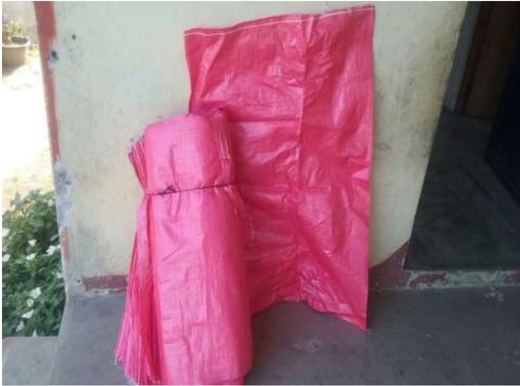
Anexo 17. Compra de sacos o costales rojo.