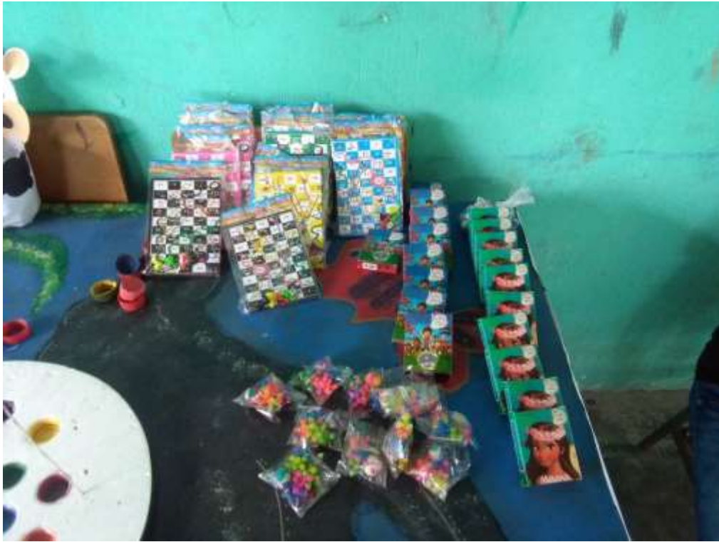
Anexo 15. Premios para juegos de la Feria del Plástico.