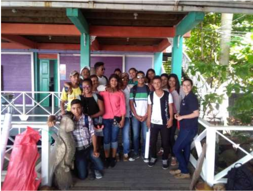
Anexo 30. Equipo R&S SAM, de El Quetzalito en Livingston.