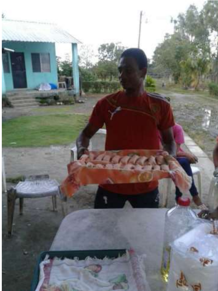
Anexo 23. Tercera venta de comida: tacos.