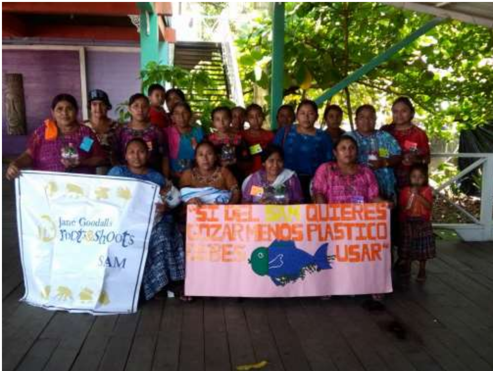
Anexo 35. Representantes de la organización de AMMUDIS.