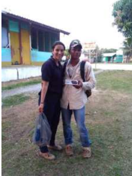
Figura 15. Entrega de premio a Daniel Ortega.