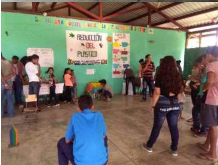
Anexo 14. Feria del plástico