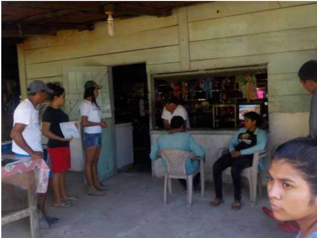
Anexo 10. Involucramiento de comunitarios al programa R&S.