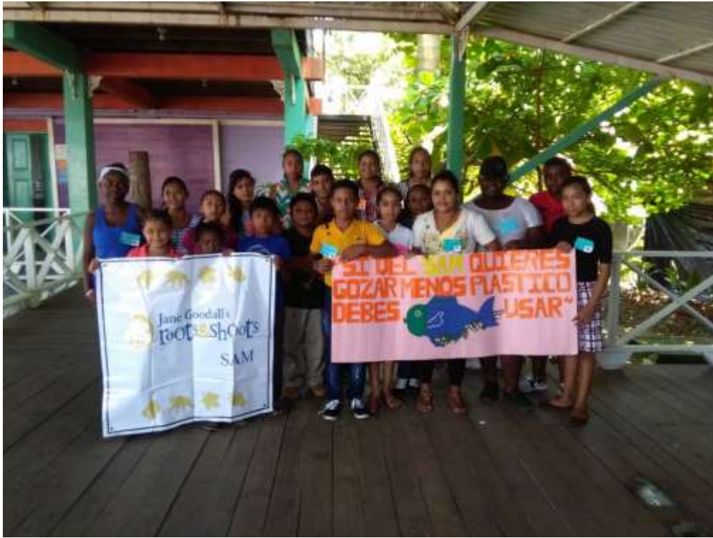
Anexo 36. Representantes de la organización de EcoLogic.