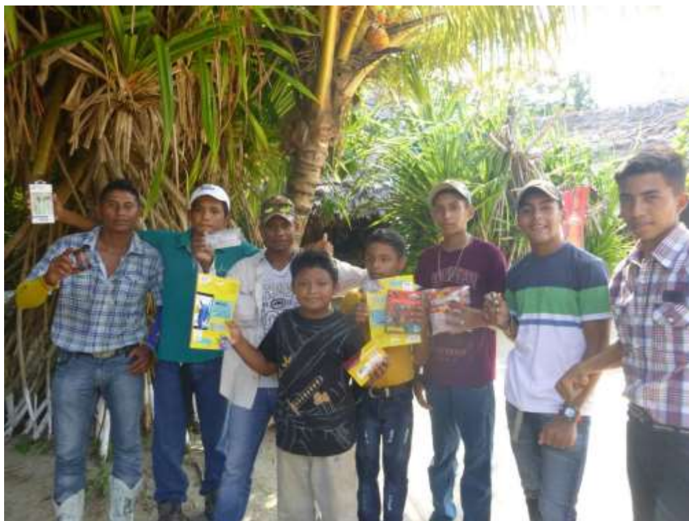
Anexo 42. Entrega de premio a equipo ganador.