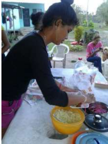
Figura 13. Venta de comida.

Como parte del Capital Semilla se realizaron compras de insumos y utensilios para la elaboración de las ventas de comidas dentro de la comunidad. Se realizaron un total de 5 ventas donde ofertaron tacos, aguas, churrascos, pollo con tajadas, tortillas de harina, entre otros. Los fondos obtenidos de las ventas fueron utilizados para la elaboración de los basureros y compra de sacos o costales (100 unidades), los cuales fueron entregados a los comunitarios (1 por familia) para almacenar los recipientes plásticos en los sacos (Figura 13).