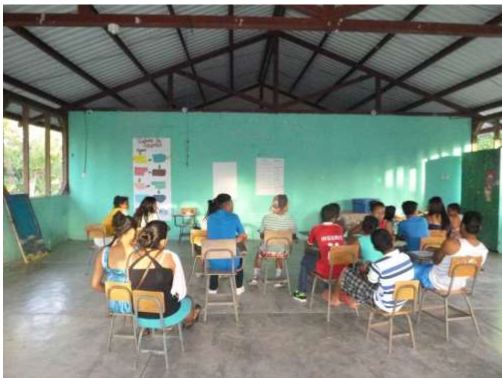
Anexo 11. Elaboración de Medidor de campaña.