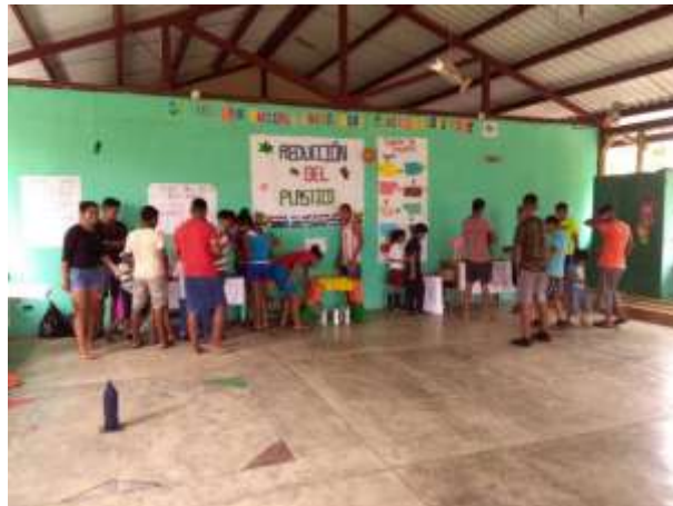
Figura 12. Juegos de la actividad Feria del Plástico.

Al finalizar las exposiciones por parte de los jóvenes se tuvo un área de juegos, los cuales se encontraban elaborados de materiales plásticos, principalmente botellas de diferentes tamaños, y un área de venta de comida. Se elaboraron un total de 7 juegos y cada uno con un costo de Q.1.00 de esta manera al igual que las ventas de comida, se recaudaron fondos para la elaboración de los basureros y compra de sacos para depositar los materiales plásticos (Figura 12).