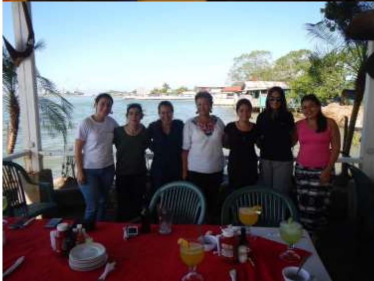
Anexo 1. Primera Reunión Regional SAM