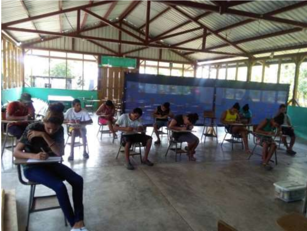
Anexo 26. Evaluación de conocimiento Post-campaña.