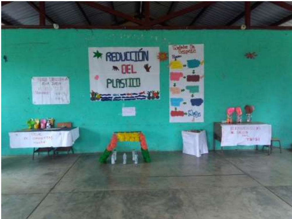
Anexo 16. Juego elaborados con material plástico.