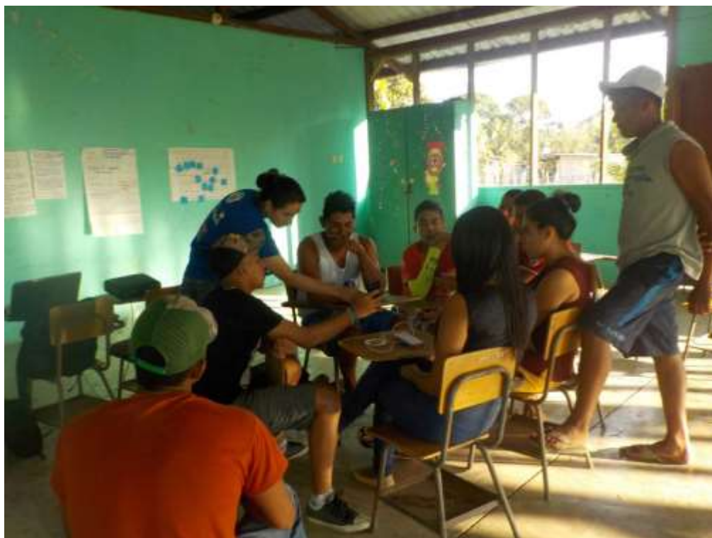
Anexo 9. Organización para actividades R&S.