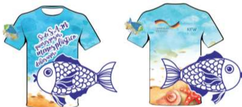
Figura 5. Diseño de playeras para el equipo Roots & Shoots SAM.

Por otra parte, al finalizar la segunda reunión regional se acordó mandar a confeccionar playeras para los coordinadores y personal que apoyó en las campañas Roots & Shoots –SAM-. Este accesorio de trabajo ayudará a destacarse entre otras organización y a realizar una identificación más rápida del equipo de trabajo. Estas se encuentran en proceso de confección, por lo cual serán entregadas a finales de mayo y principios de junio a las 7 organizaciones.