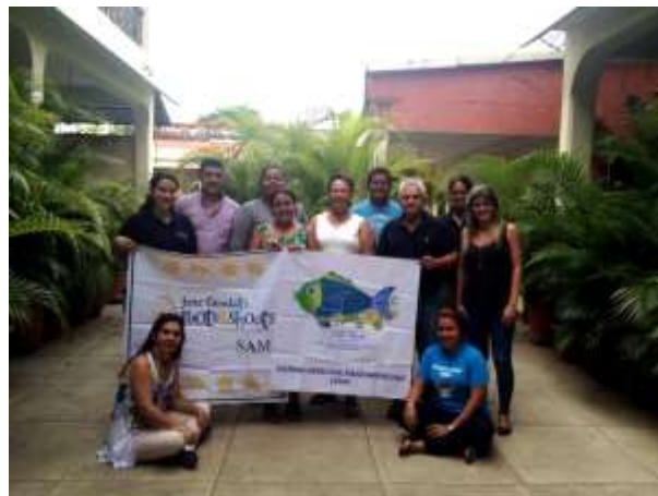
Figura 4. Segunda reunión Roots & Shoots SAM.

La segunda reunión fue llevada a cabo en Puerto Barrios, Izabal en la primera semana de mayo del presente año, contando con la participación activa de los 4 países de la región SAM, asistiendo profesionales del Institute Toledo for Development and Environmental, de Belice; Fundación Mundo Azul, EcoLogic, Healthy Reefs y AMMUDIS, de Guatemala; así como Cuerpo de Conservación de Omoa y Bay Island Conservation Association, de Honduras; y Sociedad Cooperativa de Producción Pesquera Cozumel S.C. de R. L, de México (Figura 4).