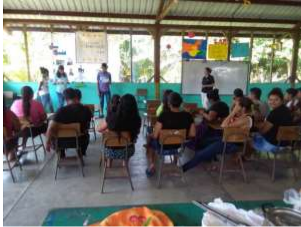
Figura 11. Exposición por parte de los jóvenes en la Feria del Plástico.

Al finalizar las exposiciones por parte de los jóvenes se tuvo un área de juegos, los cuales se encontraban elaborados de materiales plásticos, principalmente botellas de diferentes tamaños, y un área de venta de comida. Se elaboraron un total de 7 juegos y cada uno con un costo de Q.1.00 de esta manera al igual que las ventas de comida, se recaudaron fondos para la elaboración de los basureros y compra de sacos para depositar los materiales plásticos (Figura 12).