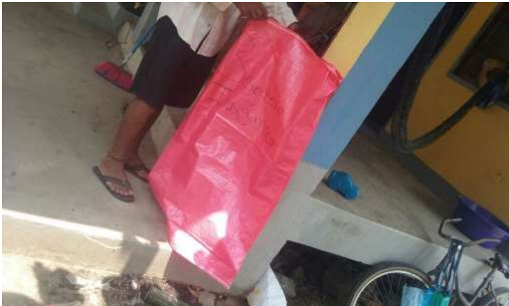
Anexo 18. Entrega de sacos a comunitarios para basura inorgánica.