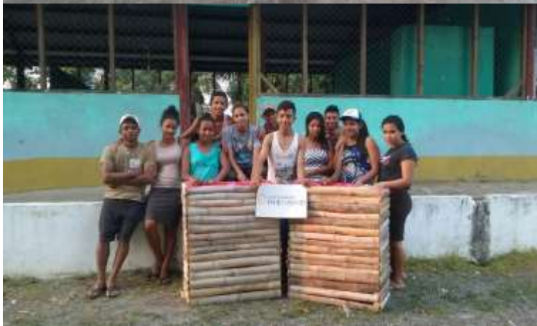
Anexo 19. Elaboración de basureros con bambú.