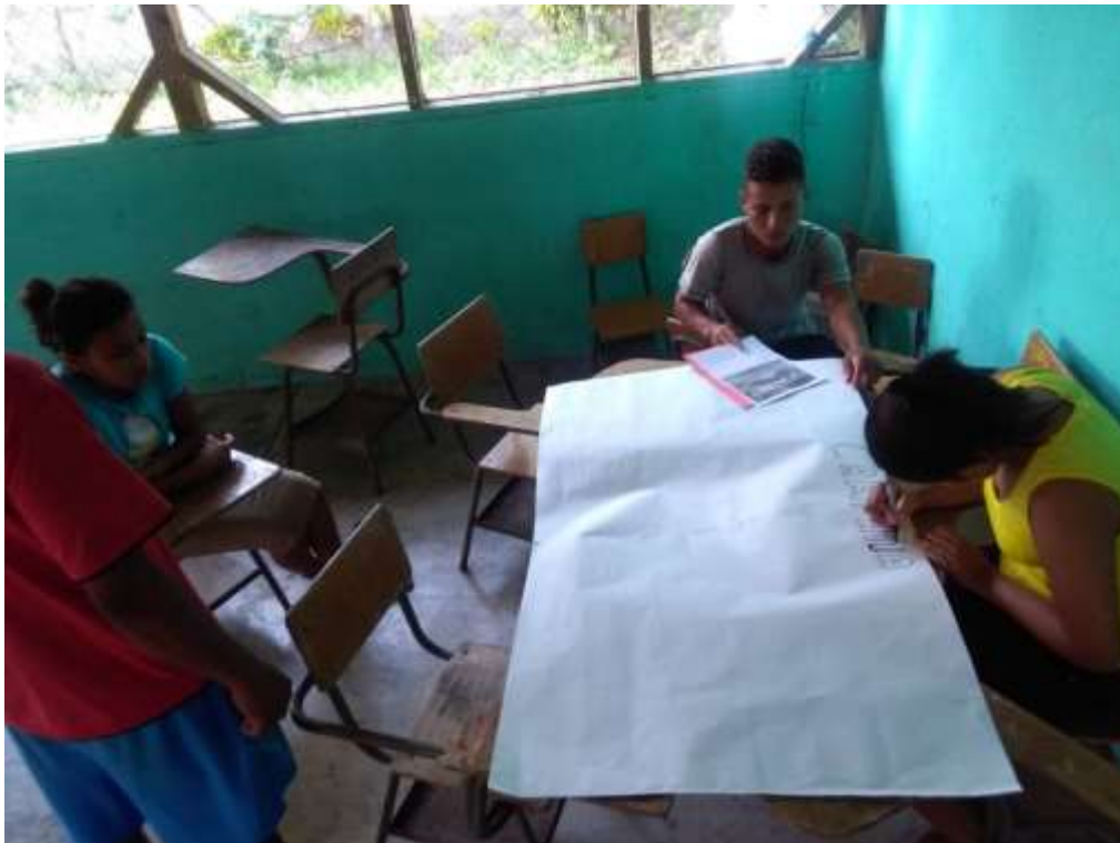
Anexo 27. Preparación de materiales para presentación en actividad de Celebración.