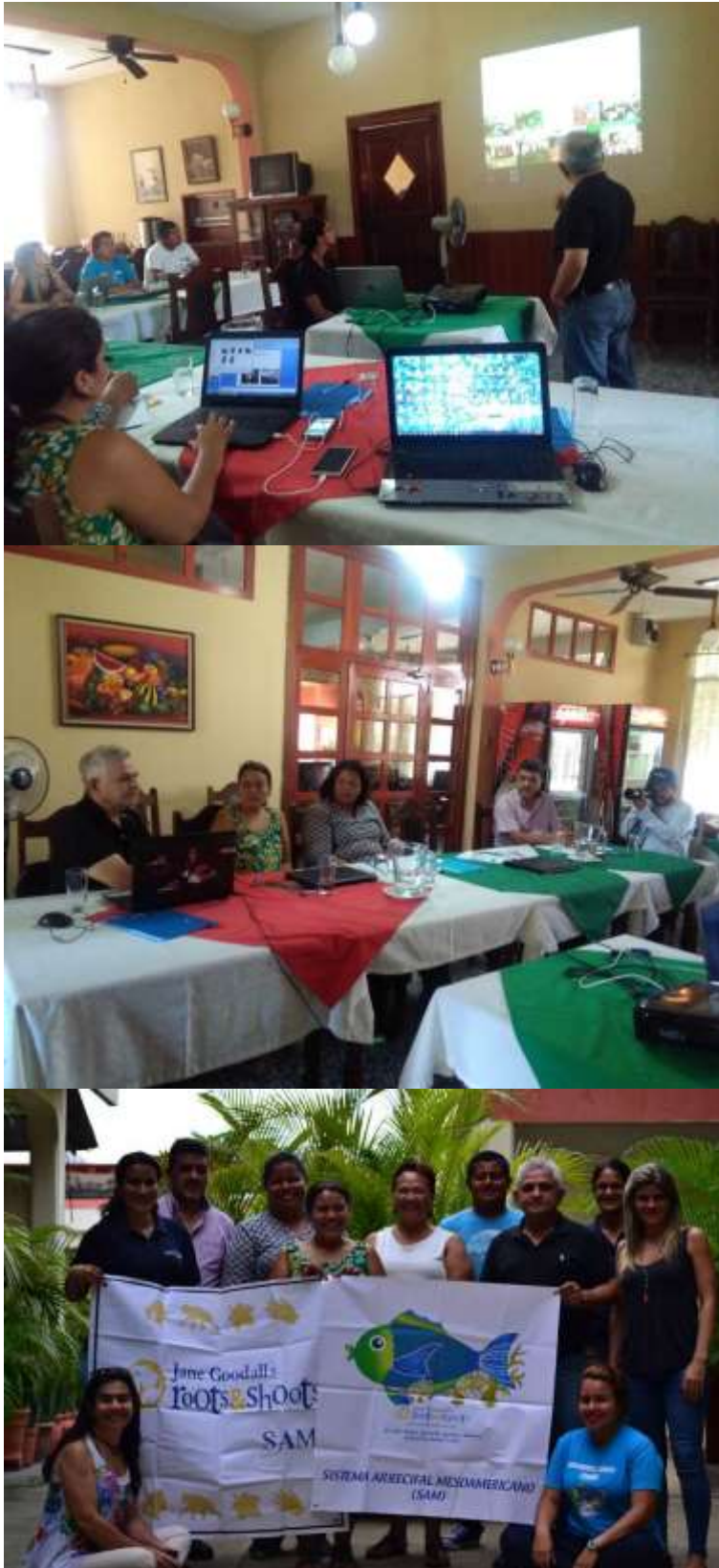
Anexo 2. Segunda Reunión Regional SAM.