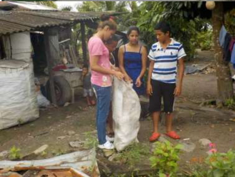
Anexo 13. Campaña de Limpieza