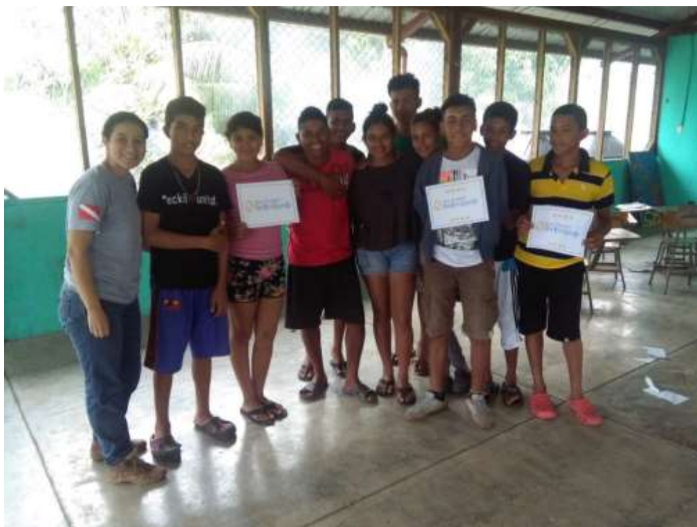
Anexo 4. Involucramiento de jóvenes de El Quetzalito en Programa R&S