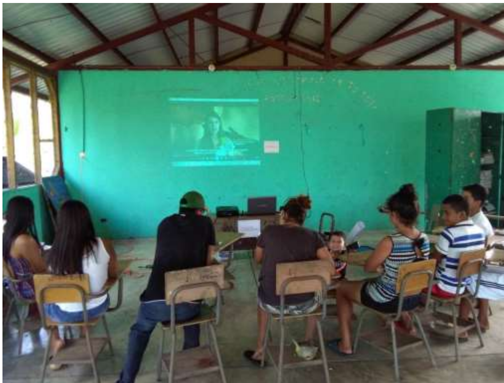
Anexo 3. Presentación de Programa R&S