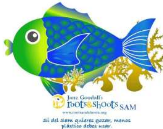
Figura 3. Logo de la campaña Roots & Shoots SAM.

Además se creó el logo y slogan de la campaña para la región SAM, siendo este: SI DEL SAM QUIERES GOZAR, MENOS PLASTICOS DEBES USAR, el cual fue utilizado en los talleres y/o reuniones impartidas por los diferentes países (Figura 3).