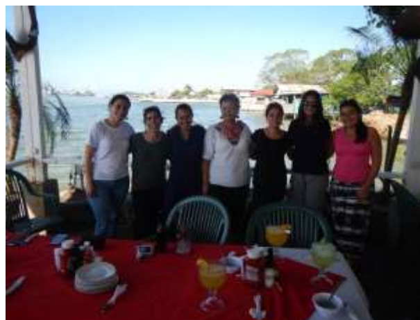
Figura 2. Equipo Roots & Shoots –SAM-

Por otra parte, las organizaciones de cada país se comprometieron a trabajar con un grupo focal (estudiantes, jóvenes, mujeres u hombres) la campaña “Reduciendo el uso del Plástico en la Región SAM”, el cual implicó un proceso participativo, de análisis y de toma de decisiones ante el problema que afrontan las diversas comunidades en relación a este tema (Figura 2).