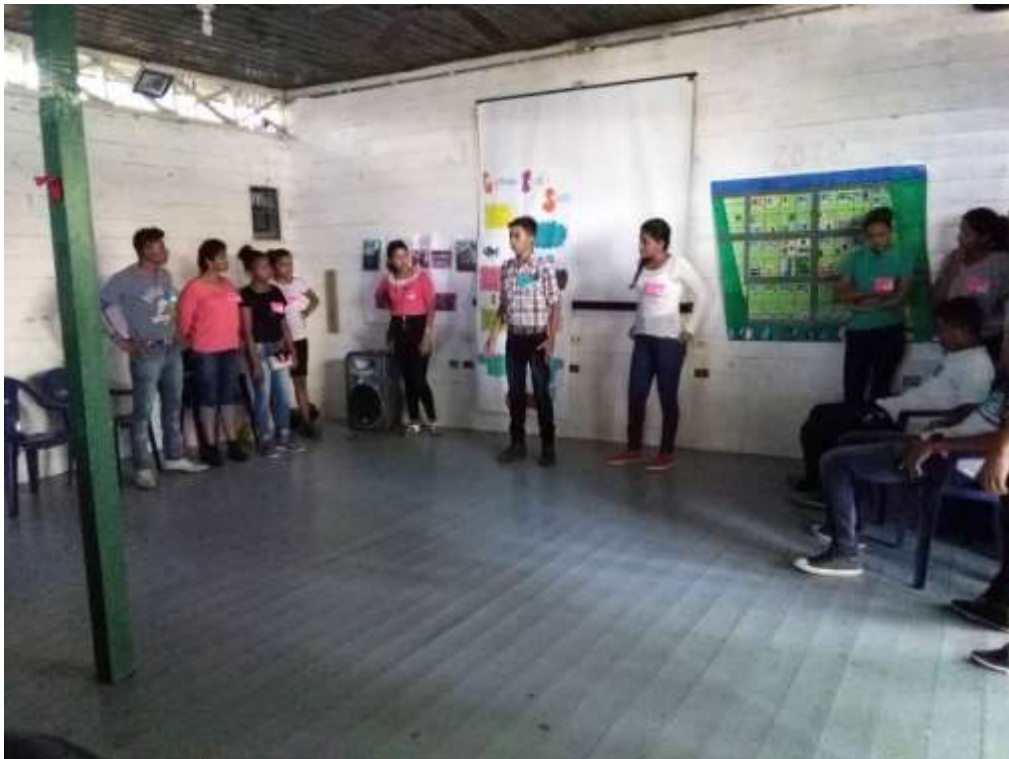
Anexo 33. Presentación de resultados de jóvenes de El Quetzalito.