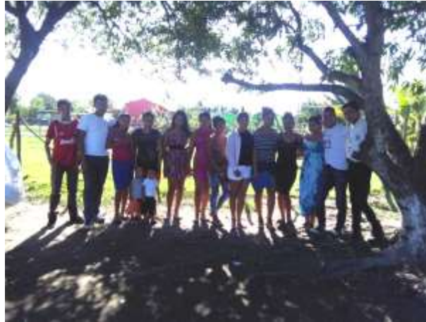
Figura 6. Jóvenes involucrados de El Quetzalito en la campaña R&S SAM.

contando con la participación de 17 jóvenes de diferentes edades, quienes desarrollaron, implementaron y ejecutaron la campaña en su comunidad. Ellos recibieron talleres informativos en donde conocieron el nuevo programa: Roots & Shoots, se les explicó el origen del programa, cuál es el objetivo, misión, sobre la metodología a emplear y se dio a conocer la biografía de Dra. Jane Goodall (Figura 6).