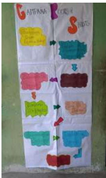
Figura 10. Medidor de campaña R&S.

A partir de las ideas se desarrolló un medidor de campaña con el objeto de utilizarlo como guía para el cumplimiento de todas las actividades que se establecieron para llevar a cabo los siguientes pasos de la campaña (Figura 10), así como los encargados y/o responsables de llevar a cabo cada una de las actividades propuestas.