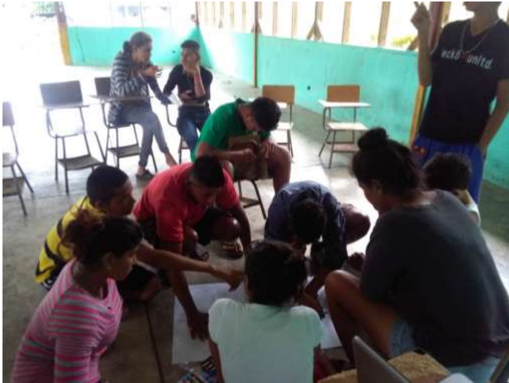
Anexo 5 Mapeo comunitario de El Quetzalito.