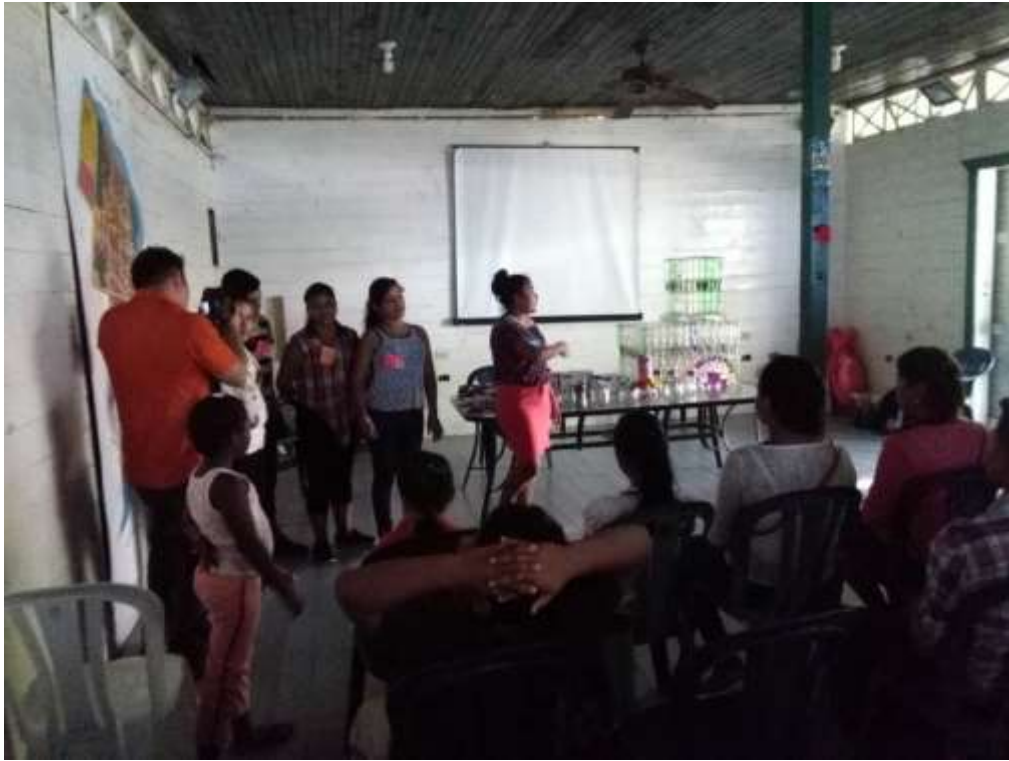
Anexo 32. Presentación de resultados de jóvenes de EcoLogic.