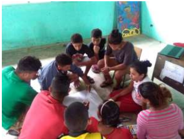
Figura 9. Mapeo comunitario de la comunidad de El Quetzalito

En este paso los jóvenes dibujaron en un papelógrafo el mapa de su comunidad, ubicando las casas, tiendas, laderas, ríos, escuela, entre otros sitios importantes, con el objetivo de visualizar la problemática del manejo de los desechos sólidos en especial el del plástico (Figura 9).