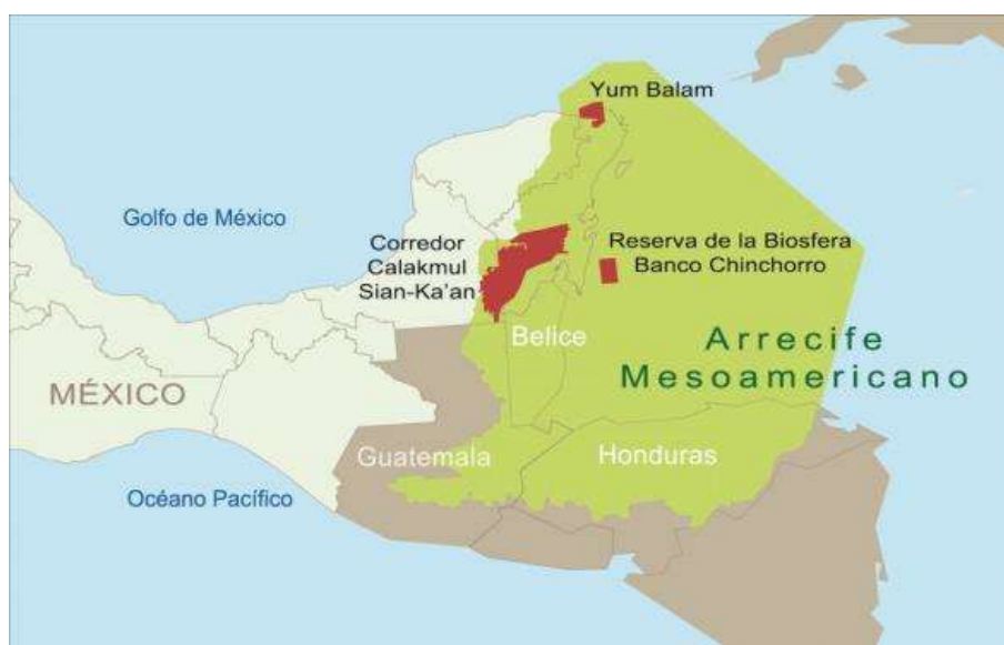
Figura No.1 Sistema Arrecifal Mesoamericano (SAM).

El Sistema Arrecifal Mesoamericano (SAM) es un conjunto de ecosistemas que nos brinda diferentes beneficios a la población de Belice, Guatemala, Honduras y México. Es el segundo sistema de arrecifes más grande del mundo seguido de la Gran Barrera de Coral de Australia.