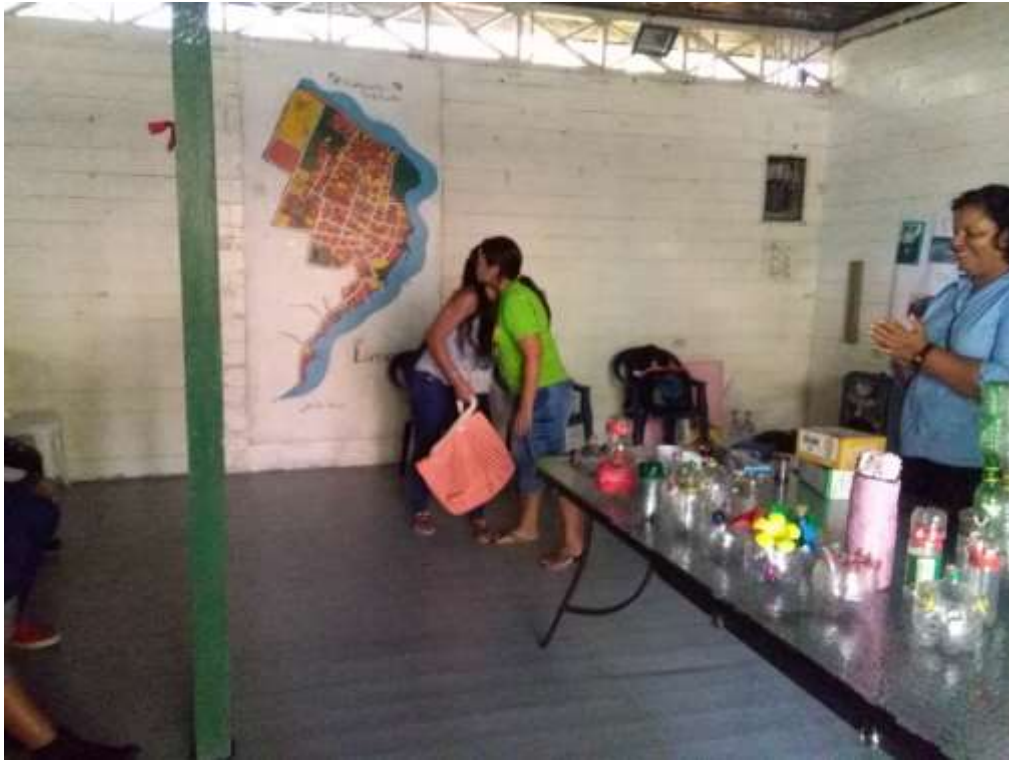
Anexo 34. Entrega de premios a jóvenes de EcoLogic.