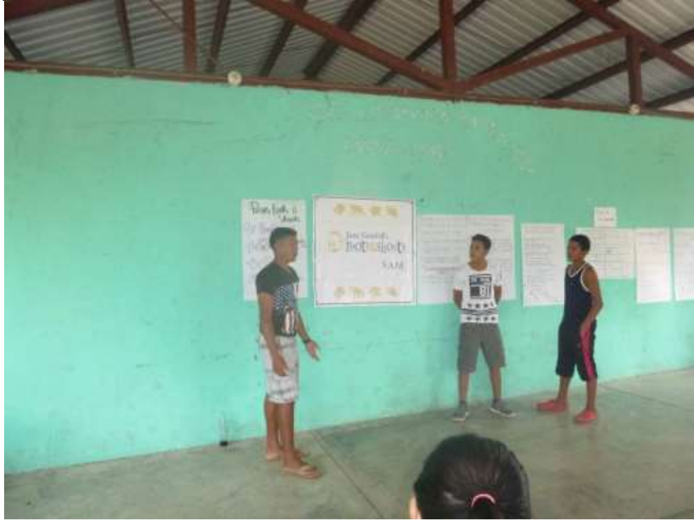
Anexo 7. Presentación de soluciones para Reducir el plástico.