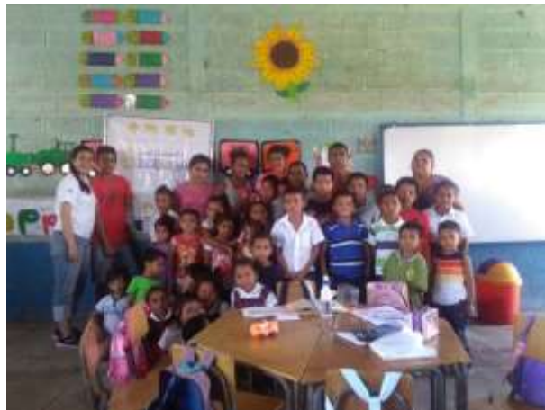
Figura 8. Impartición de clases por parte de los jóvenes de equipo R&S.

Los jóvenes por medio de impartición de clases de educación ambiental, enfocadas a la reducción de plástico, involucraron a los estudiantes de pre primaria, primaria y básico. La finalidad de las clases, también fue concientizar a los niños y/o jóvenes sobre la problemática del plástico dentro de su comunidad y las diversas acciones que pueden realizar para disminuir y manejar los desechos sólidos, como lo son los materiales plásticos (Figura 8).