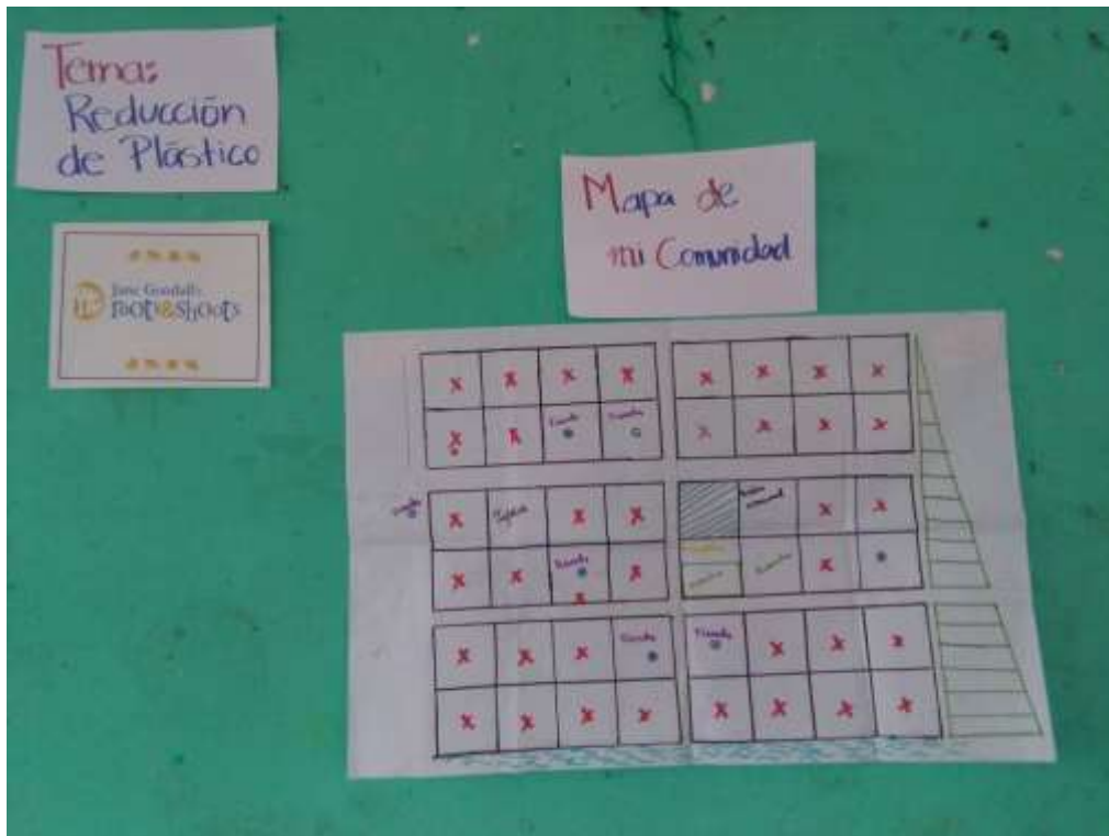
Anexo 6. Mapa de la comunidad El Quetzalito.