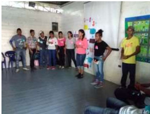
Figura 14. Presentación de resultado por parte de los jóvenes de El Quetzalito.

La celebración se llevó a cabo el día miércoles 26 de abril del presente año en el restaurante Buga Mama en Livingston, Izabal. Esta actividad se realizó en conjunto con las organizaciones de AMMUDIS y EcoLogic, cada grupo fue encargado de realizar una breve presentación sobre la ejecución de su proyecto: ¿Qué hicieron?, ¿Cómo lo hicieron? y el impacto que tuvo su campaña. El primer grupo en exponer fueron las señoras de la organización de AMMUDIS, quienes trabajaron artesanías con el plástico, así como sus huertos con dicho material. En cuanto a los jóvenes de EcoLogic, su proyecto se centró en la elaboración de basureros con botellas plásticas y algunas artesanías, como los porta lapiceros, floreros, entre otros. Y el tercer grupo en presentar fueron los jóvenes de El Quetzalito, quienes expusieron cómo llevaron a cabo su campaña, tomando en cuenta los 4 pasos del programa Roots & Shoots (Figura 14).