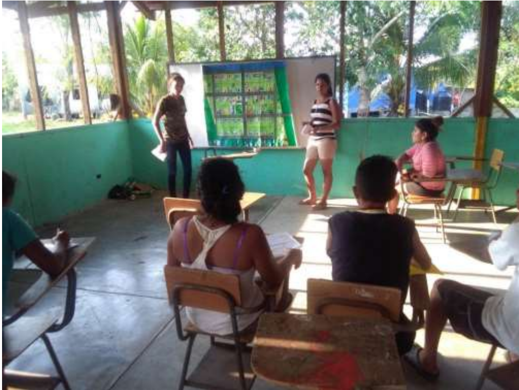
Anexo 28. Preparación previa a la presentación en la Celebración.