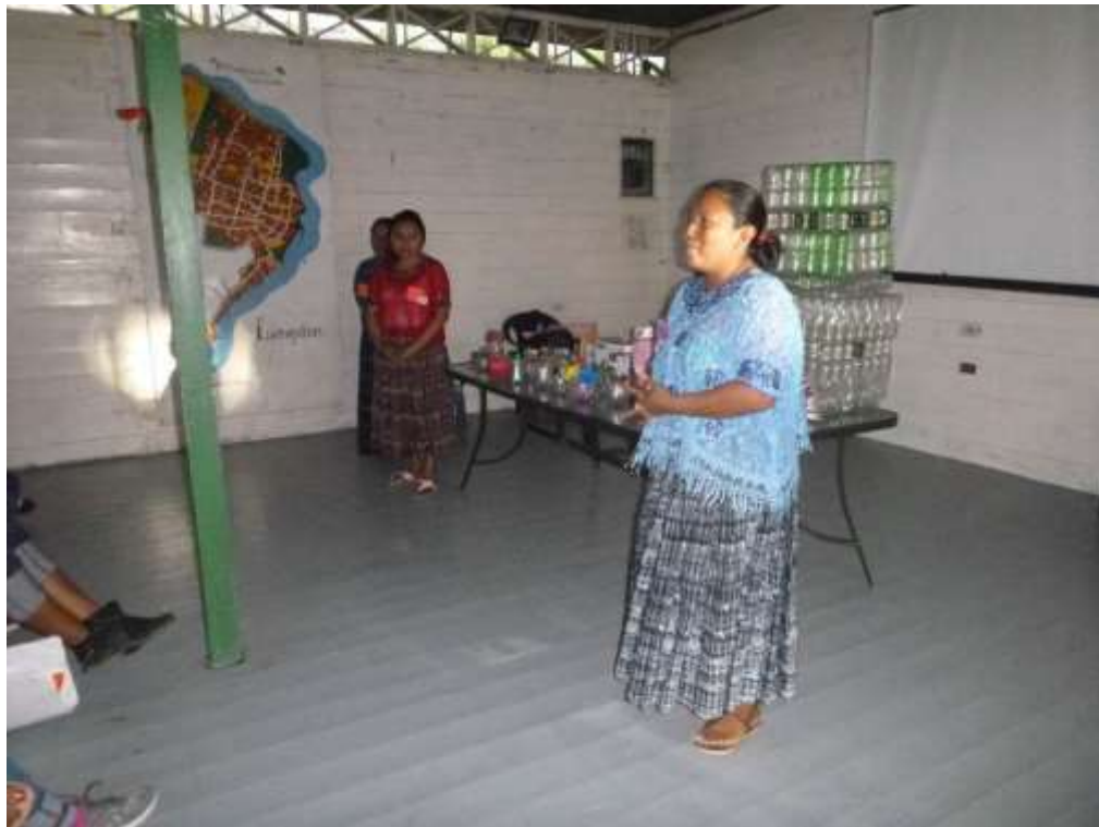
Anexo 31. Presentación de resultados de mujeres de AMMUDIS.