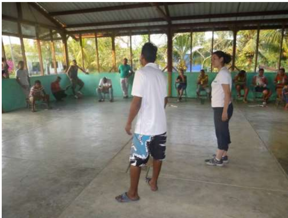
Anexo 8. Presentación de proyecto a Comité de pescadores.