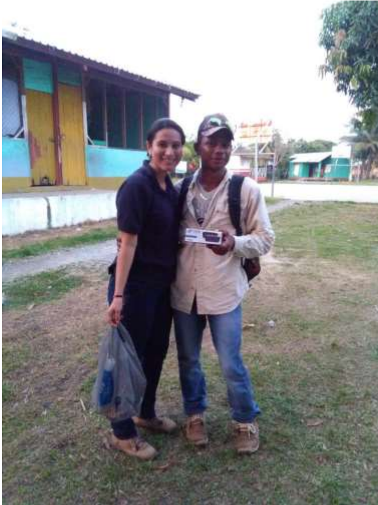
Anexo 45. Entrega de premio por mayor participación a Daniel Ortega.