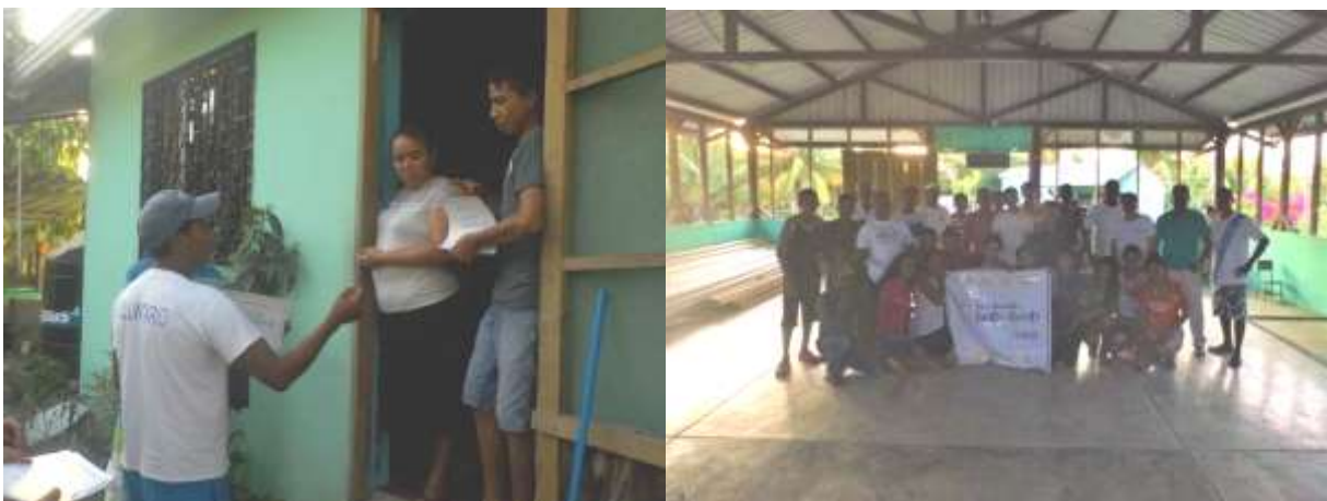
Figura 7. Involucramiento de miembros de la comunidad y comité de pescadores de El Quetzalito.

Los miembros de la comunidad El Quetzalito también fueron involucrados en la campaña por medio de reuniones directas por parte de los jóvenes, ya que ellos decidieron pasar de casa en casa para hablarles a los comunitarios sobre el proyecto en el estuvieron trabajando, de esta manera obtuvieron el apoyo de cada miembro de la comunidad, así como el apoyo del Comité de Pescadores de El Quetzalito. De esta manera cada comunitario estuvo involucrado indirectamente en la campaña (Figura 7).