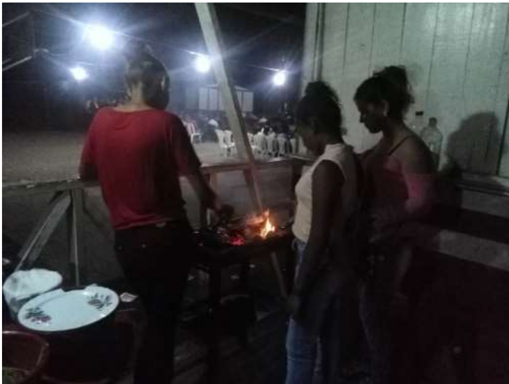
Anexo 22. Segunda venta de comida: churrasquitos